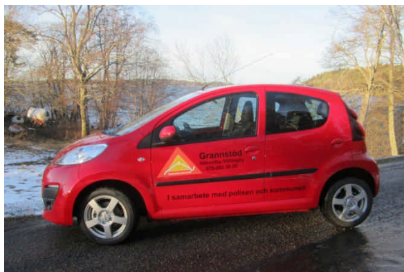
Bilden: Den nya grannstödsbilen.

Bo Malmqvist, 0706- 96 06 13 eller Berit Arkéus, 0707- 28 05 35